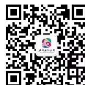
五洲植物乐园公众号