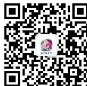
五洲植物乐园服务号